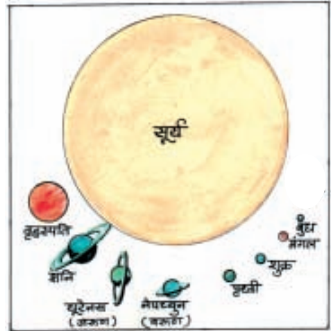
सूर्य की तुलना में ग्रहों का आकार

उपग्रह- ऐसे आकाशीय पिण्ड जो ग्रहों की परिक्रमा करते हैं। 'उपग्रह' कहलाते हैं। उपग्रह भी सूर्य से प्रकाश और ऊष्मा प्राप्त करते हैं। बुध और शुक्र को छोड़ सभी ग्रहों के अपने-अपने उपग्रह हैं। चन्द्रमा हमारी पृथ्वी का एकमात्र प्राकृतिक उपग्रह