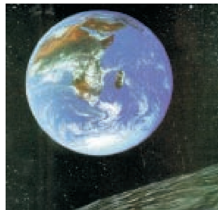
चन्द्रमा से लिया गया पृथ्वी का चित्र

सही-सही माप के बाद पता चला कि पृथ्वी एकदम गोल नहीं बल्कि ध्रुवों पर कुछ चपटी है। अंतरिक्ष से देखने पर हमारी पृथ्वी का आकार गोल दिखाई देता है।