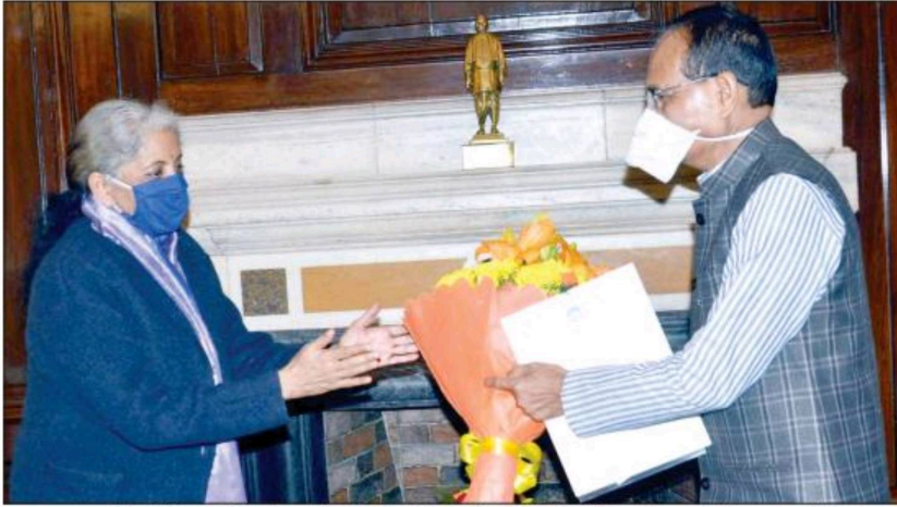
मुख्यमंत्री श्री शिवराज सिंह चौहान ने नई दिल्ली में केंद्रीय वित्त मंत्री श्रीमती निर्मला सीतारमण से मुलाकात की।

वित्त मंत्री के साथ लगभग एक घंटे चली बैठक में मुख्यमंत्री श्री चौहान ने विभिन्न वित्तीय मुद्दों, प्रधानमंत्री स्वनिधि योजना, मुख्यमंत्री ग्रामीण पथ विक्रेता योजना, केंद्र में पूंजीगत कार्यों के लिए लम्बित शेष राशि और एक प्रतिशत (विना शर्त) अतिरिक्त ऋण स्वीकृति के बारे में विस्तार से चर्चा की।