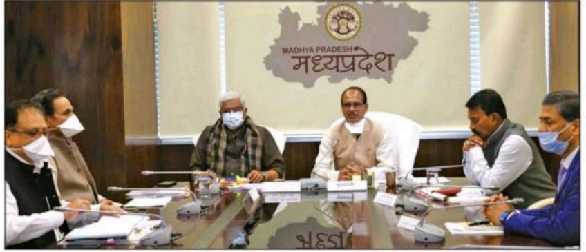
केंद्रीय जल शक्ति मंत्री श्री गजेन्द्र सिंह शेखावत और मुख्यमंत्री श्री शिवराज सिंह चौहान भोपाल में अटल भू-जल योजना एवं जल शक्ति मिशन की प्रगति की समीक्षा करते हुये।

श्री चौहान ने कहा कि सिंगापुर के तकनीकी परामर्श एवं सहयोग से ग्लोबल स्किल पार्क भोपाल का निर्माण 30 एकड़ क्षेत्र में हो रहा है। यह उनका ड्रीम प्रोजेक्ट है। वर्ष 2017 में यह योजना बनाई गई थी। इस उद्देश्य से उन्होंने सिंगापुर भ्रमण किया था। इस क्षेत्र में सिंगापुर की विशेषज्ञता है। सपना यह है कि बच्चों के हाथ में इतना हुनर आ जाए कि उन्हें प्लेसमेंट मिल जाए। भोपाल का स्किल पार्क इस उद्देश्य को पूरा करेगा। मुख्यमंत्री ने कहा कि इस स्किल पार्क का कार्य अब तेजी से चलना चाहिए। पूर्व सरकार के समय आई बाधाओं के कारण विलंब अवश्य हुआ है। पूर्व सरकार ने ध्यान भी नहीं दिया। हमारा लक्ष्य इस